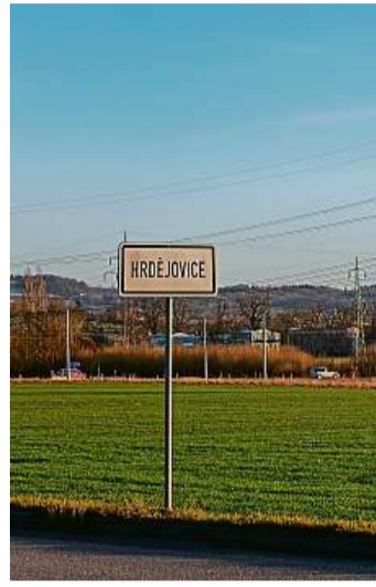
Tady měly stát haly Společnost CTP koupila pozemky mezi železniční tratí a Pražskou třídou.

Proti záměru vystupovalo i město České Budějovice, okolní obce